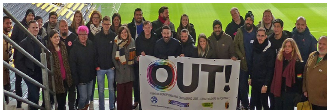
Football Supporters Europe

On January 23, 2019 an important networking event, dealing with the role of football clubs and players to take a stand against homophobia, took place in Dortmund, Germany. Of course, the Austrian ombuds office also participated in this event and was able to provide valuable input. A future plan is to collectively compile and publish a handbook on the subject for football clubs and players.